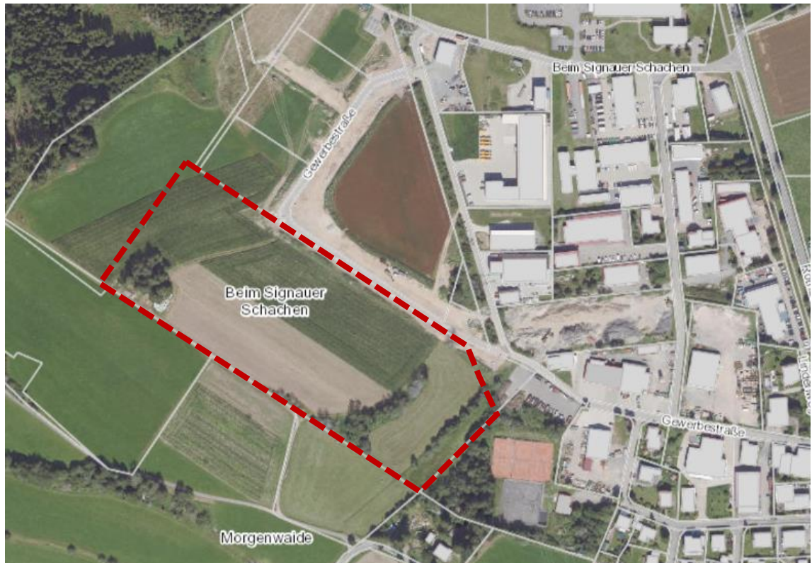
Luftbild mit Abgrenzung des Geltungsbereichs

Das ca. 4,88 ha große Plangebiet befindet sich am nordwestlichen Ortsrand der Gemeinde Grafenhausen. Der Geltungsbereich wird im Norden und Osten durch die bestehenden Gewerbegebiete „Morgenwaide“ und „Signauer Schachen“ begrenzt. Im Süden und Westen grenzen landwirtschaftliche Flächen an das Plangebiet an.