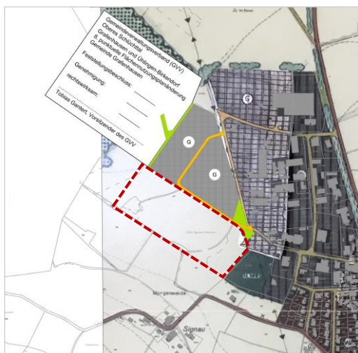
Ohne Maßstab; rot gestrichelte Linie ungefähre Abgrenzung des Änderungsbereichs