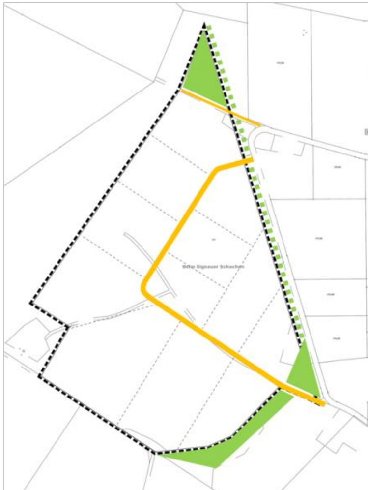
Gewerbeentwicklungskonzept 2018

Die Planung entspricht dem Gewerbe-Entwicklungskonzept von 2018, das eine Entwicklungsfläche von 7,7 ha (davon ca. 7 ha Gewerbe) vorsah. Die Planung für das Gewerbegebiet musste aus Gründen des Bedarfsnachweises im Jahr 2019 auf einen ersten 4,5 ha großen Entwicklungsabschnitt (davon ca. 3,7 ha Gewerbe) reduziert werden. Die vorliegende Nachfrage umfasste damals 2,2 ha, die Reservefläche betrug ca. 1,5 ha. Der Satzungsbeschluss für den Bebauungsplan „Gewerbegebiet Morgenwaide“ wurde Anfang 2021 gefasst und die Erschließung im September 2022 abgeschlossen. Entsprechend den Einschätzungen der Gemeinde hielt die Nachfrage (siehe oben) an, weshalb schon sehr bald erneute Engpässe erkannt wurden.