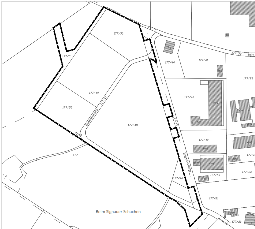
Abgrenzung des Plangebiets (Geltungsbereich)