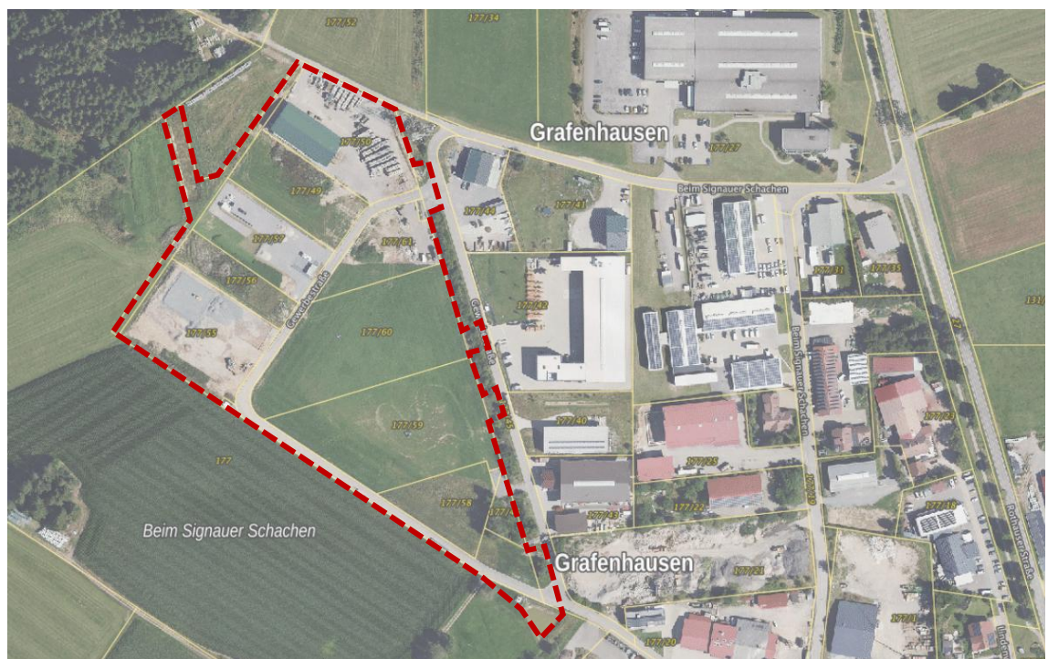
Luftbild mit Abgrenzung des Geltungsbereichs in rot