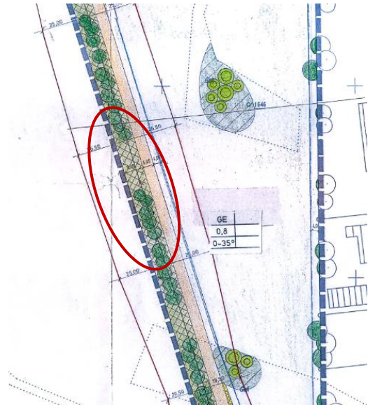
Ausschnitt aus dem Bebauungsplan „Signauer Schachen“ Teil II von 1999 mit Markierung des Überlagerungsbereichs