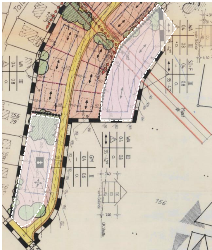
Überlagerung des BPLs Ebnet (ohne Maßstab)

Im Bebauungsplan Ebnet aus dem Jahr 1989 bzw. der Änderung von 1993 wird die Überlagerung nach der Rechtskraft des vorliegenden Bebauungsplans „Änderung Ebnet“ in den beiden Teilbereichen durch jeweils ein weißes Deckblatt kenntlich gemacht.