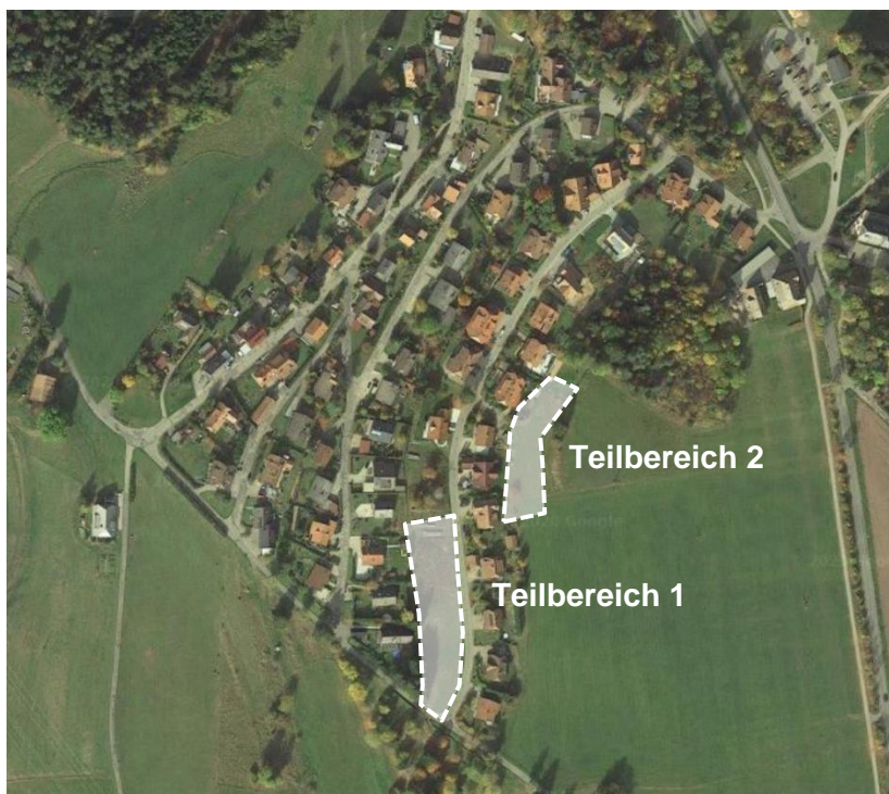
Luftbild mit Lage des Geltungsbereichs (Teilbereich 1 und Teilbereich 2), Quelle: Google Maps 2020