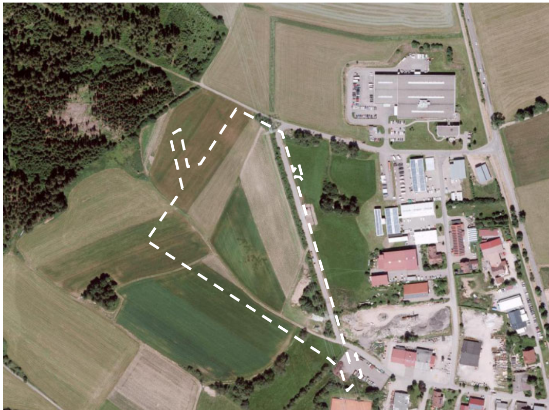
Lage des Plangebiets im Luftbild – vereinfachte Darstellung