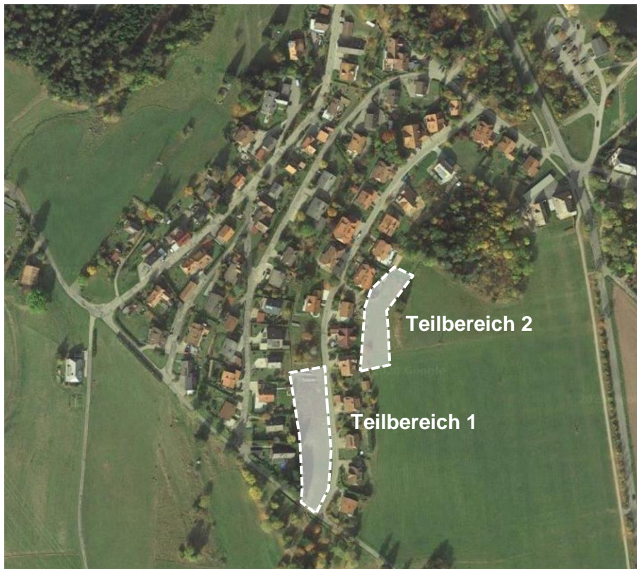
Luftbild mit Lage des Geltungsbereichs (Teilbereich 1 und Teilbereich 2)